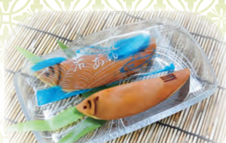
若あゆ 1ヶ 270円(税込) ※8月末までの販売となります。