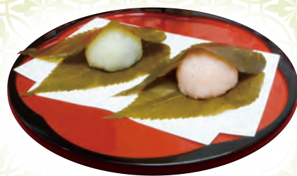
「さくら餅」こし餡/白餡 各270円(税込) ※3月上旬から4月上旬までの販売となります。