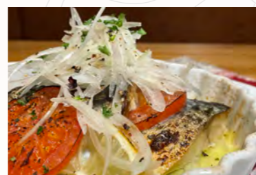
塩サバと片浦レモンとフレッシュトマトのオープン焼き ¥1,100(税込)

地元の新鮮な食材を使った、美容と健康に優しいメニューで評判の洋食店「パルールド」。抗酸化作用のある片浦レモンとたっぷりの野菜、サバやスベアジを組み合わせた料理が食べられます。疲労回復・血液サラサラ・美容作用…そして何より美味しくして HAPPY♪