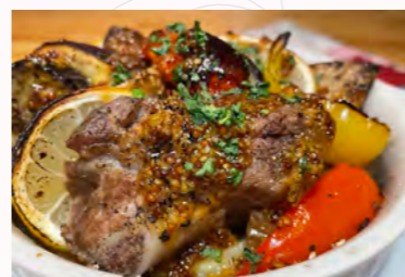
片浦レモンとコロコロ野菜のスパイスグリル ¥1,320(税込)

地元の新鮮な食材を使った、美容と健康に優しいメニューで評判の洋食店「パルールド」。抗酸化作用のある片浦レモンとたっぷりの野菜、サバやスベアジを組み合わせた料理が食べられます。疲労回復・血液サラサラ・美容作用…そして何より美味しくして HAPPY♪