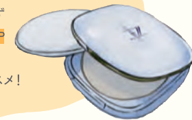
プロテクトパウダー 12.5g ¥4,950 ケース ¥1,100