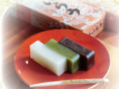
伝統の棗菓子「お菓子のういろう」 1棗 756円(税込) ~

小田原銘菓「ういろう」 お菓子の始まりは、室町時代に外郎家が考案した米粉の蒸し菓子が評判になり、家名より「ういろう」と呼ばれ各地へ広まりました。本家本元は、もっちりとした食感とほのかな甘さが特徴です。そのほか、季節限定などの手作り和菓子で皆様をお待ちしております。