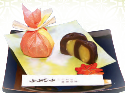
季節の和菓子「栗むし」 1個 270円(税込) ※9月上旬より販売