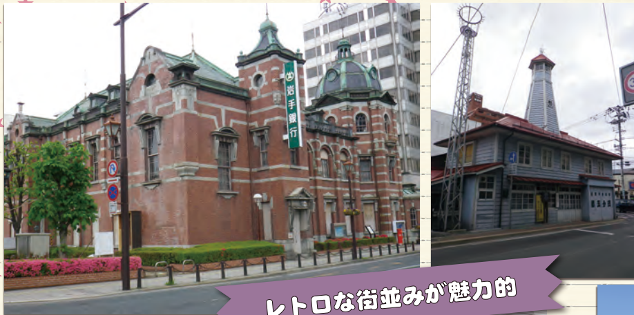
レトロな街並みが魅力的

ANGEのスタッフが旅をした様々な場所を紹介していく「旅する天使たち」。 今回は岩手県盛岡市です！ニューヨーク・タイムズ「2023年に行くべき52カ所」に 選ばれるなど、今とても人気の街です。