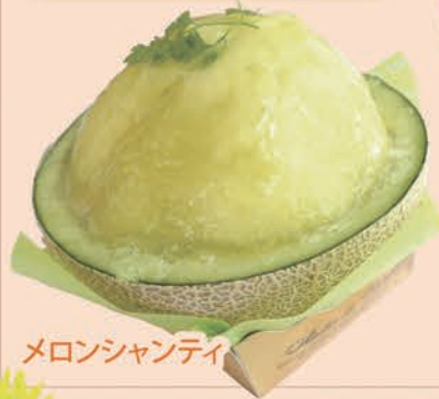
メロンシャンティ