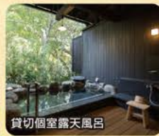
貸切個室露天風呂