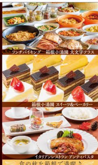
ランチバイキング 箱根小涌園 大文字テラス