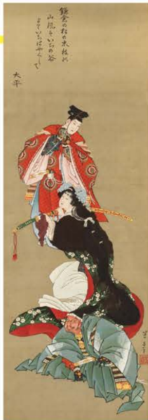
葛飾北斎 「堀河夜討図」(部分) 19世紀前半 岡田美術館蔵