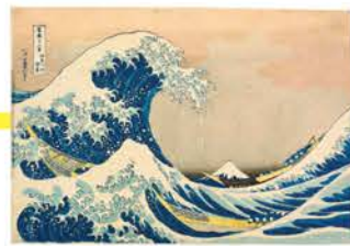
葛飾北斎「富嶽三十六景 神奈川沖浪裏」天保2~4年(1831~33)【展示期間:4/5~6/1】岡田美術館蔵