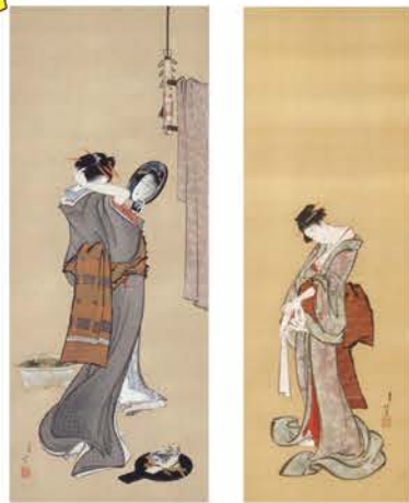
葛飾北斎 「夏の朝」(部分) 19世紀初頭 岡田美術館蔵