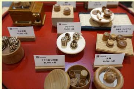
職人さん手作りのミニチュア家具たち

可愛らしい小物類も揃っています。 プレゼントに、手土産に、自分用に... ぜひ手に取ってみてください。