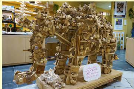
TAKUMI館のアイドルです！