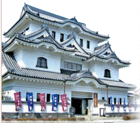
本店は伝統の八棟通りの店構え

小田原市栄町 1-2-10 営業時間 9:00~18:00(喫茶 LO.17:00) (年末年始休業 1/1)