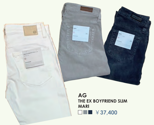
AG THE EX BOYFRIEND SLIM MARI ¥37,400