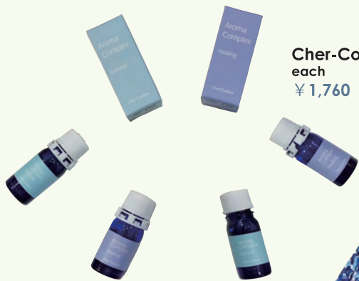
Cher-Couleur each ¥1,760