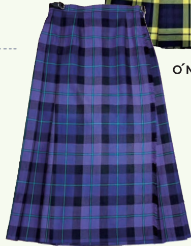
O'NEIL OF DUBLIN ¥28,600 ¥29,700