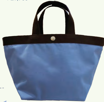
Herve Chapelier ¥29,700