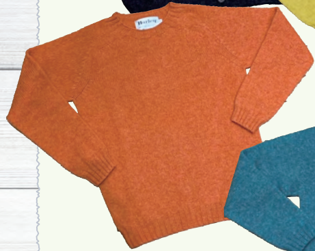
Harley Knit ¥15,950 Cardigan ¥20,350