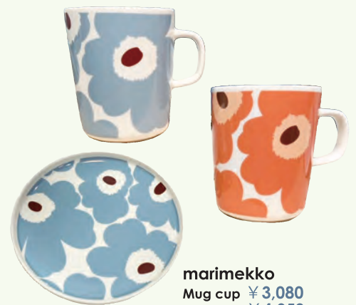
marimekko Mug cup ¥3,080 Plate ¥4,950 Socks ¥3,850