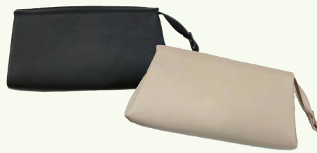
Dono Wallet ¥22,000