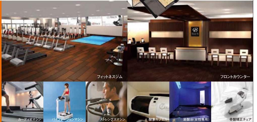
フィットネスジム

第2期会員募集 3/12 300名限定 (金)まで 入会金¥18,000が いまなら ¥0