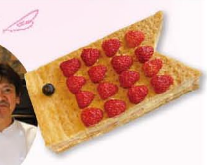
ケーキ制作 きゃとるふいーゆ ☎ 0465-35-1342 ♣ 小田原市城山1-6-32