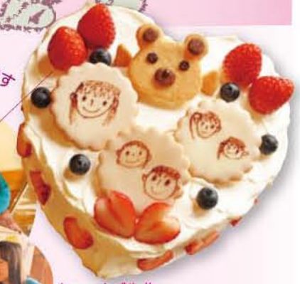
ケーキ制作 菓子工房 夢たまご ☎ 0465-22-2388 ♣ 小田原市板橋178