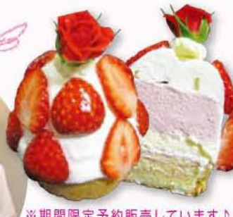
※期間限定予約販売しています♪ ケーキ制作 メロウレジェンド ☎ 0465-72-4777 ♣ 南足柄市壺下587