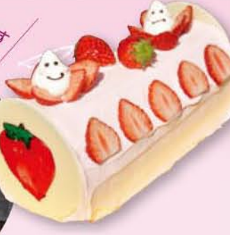
ケーキ制作 フロマーージュ ☎ 0465-47-1911 ♣ 小田原市中里185-17