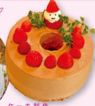
ケーキ制作 Sweet Berry ☎ 0465-35-5516 ♣ 小田原市久野71-4