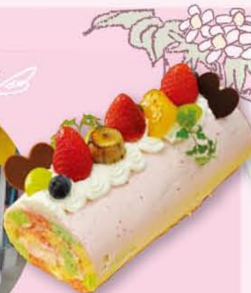
ケーキ制作 創業工房 なかじま ☎ 0465-36-1267 ♣ 小田原市堀之内243