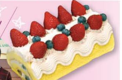
※いちごフェアの期間中 商品として店頭に出ました！ ケーキ制作 樫の樹 ☎ 0465-36-8838 ♣ 小田原市曾比2209-1