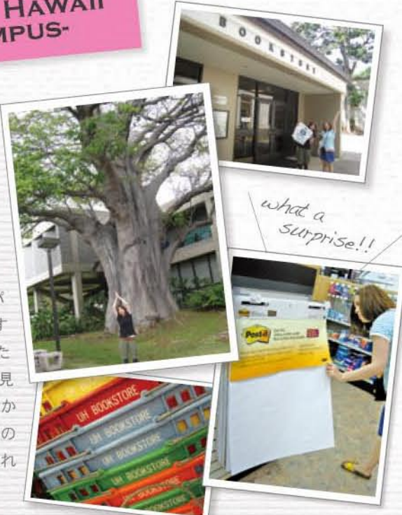
what a surprise!!

外へ出ると緑がいっぱいのキャンパス。"この木なんの木"は有名ですが、チューリップが木に咲いていたり、垂れ下がる枝がネズミのように見える木があったり、と珍しいものばかり。大きく成長する樹木のように、のびのびとしたキャンパスライフを送れそうな環境がうらやましいですね。