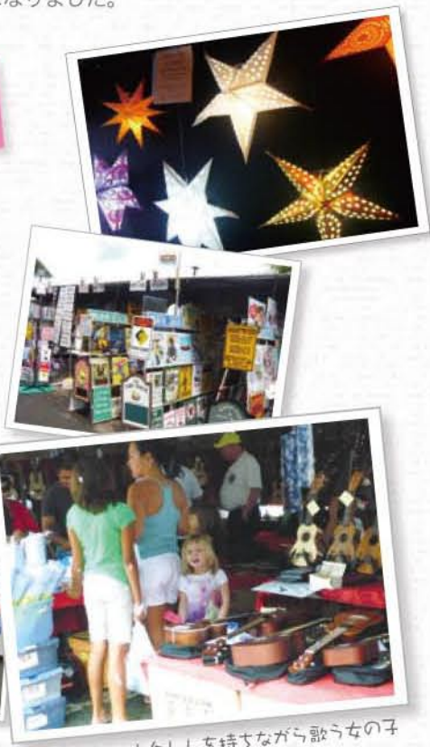
ウケしを待ちながら遊ぶ女の子

アロハシャツやアクセサリー、雑貨など、とにかくまとめ買いするとお得な店ばかり。この日一番の掘り出し物は紙製の星形ランプでした。