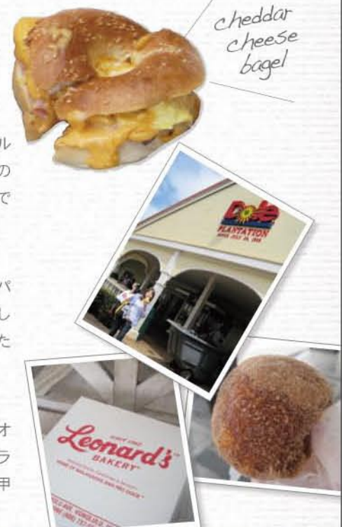
Cheddar cheese bagel

Leonard's Bakery どうしても行きたかった揚げパン屋さんへ。オーダーしてから揚げるしっとりフワフワのマラサダを食べられて大満足! 片道30分歩いた甲斐がありました。