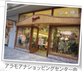
アラモアナショッピングセンター内

50年以上の歴史をもつ老舗アロハシャツブランドのBag。キャンパス地で使いやすさを考えて作られているのでリピーターが多く、バッグだけでなく傘やタオルなどの小物類も人気です。