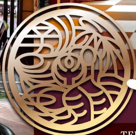
名月(客室露天風呂)