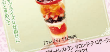
「フレジエ」1,559円 小田原山のホテル デザートレストラン サロンド・ロザージュ TEL.0460-83-6321