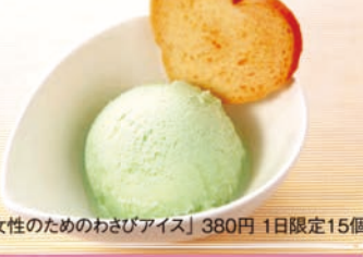
「女性のためのわさびアイス」380円 1日限定15個 Go! Go! Wimpy