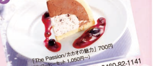
「The Passion」カカオの魅力! 700円 (illyコーヒーセット1,050円) 彫刻の森美術館ギャラリーカフェ TEL.0460-82-1141