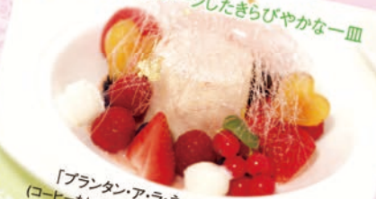
「ブランドン・ア・ラ・ネージュ」1,000円 (コーヒーもしくは紅茶付1,400円) 1日限定10個 箱根ホテル イル ラーゴ TEL.0460-83-6311