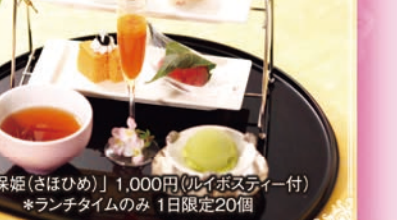
「佐保姫(さほひめ)」1,000円(飲み会2人付) ※ランチタイムのみ 1日限定20個 ホテルはつはな つつじの茶屋