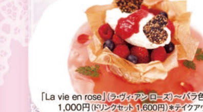
「La vie en rose」(ラ・ヴィ・エン・ローズ)~はつはなの人生~ 1,000円(ドリンクセット1,600円) ※テイクアウトあり 箱根ホテル小涌園 ラウンジ アゼリア