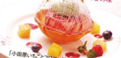
「小田原いちごプロデュース」のムース タンバリン粉飾り 1,155円 (コーヒーもしくは紅茶付1,386円) 箱根ハイランドホテル ラウンジ TEL.0460-84-8541