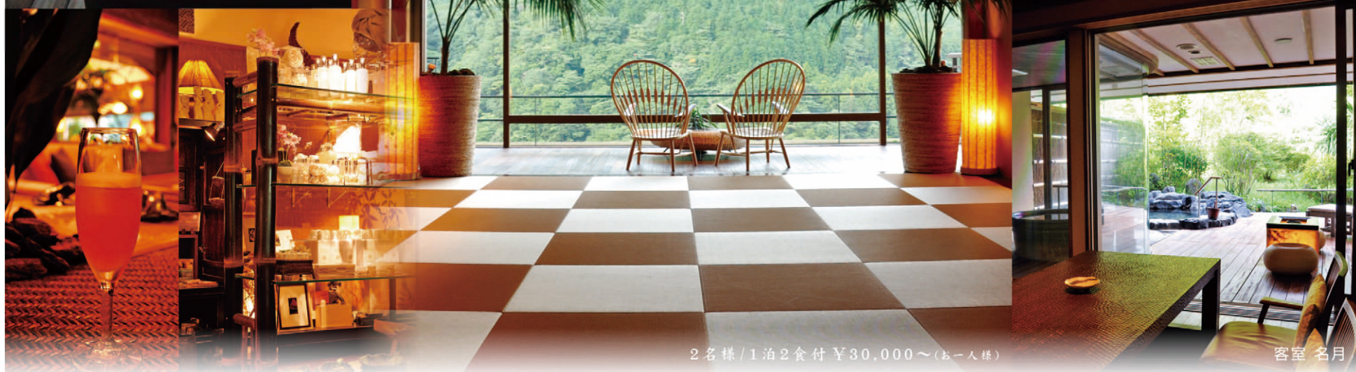
2名様/1泊2食付 ¥30,000~(お一人様)