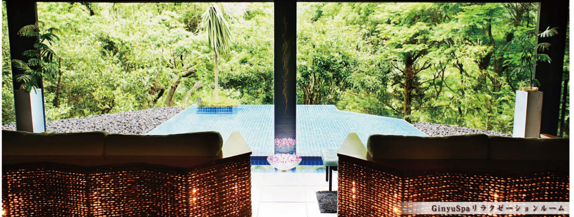
GinyuSpaリラクゼーションルーム