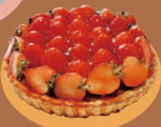
きゃとるふいーゆ 「イチゴのタルト」5号 ¥3,200