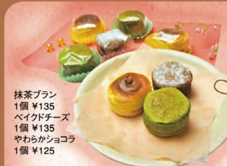
抹茶ブラン 1個 ¥135 ペイコドチーズ 1個 ¥135 やわらかショコラ 1個 ¥125