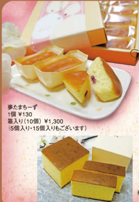
夢たまご 1個 ¥130 箱入り(10個) ¥1,300 (5個入り・15個入りもございます)