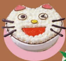
夢たまご 「ねこちゃん デコレーション」 5号 ¥2,735