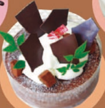
スウィートベリー 「蒸し焼きショコラ」5号 ¥2,730