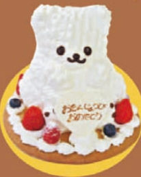
樫の樹 「白くまデコレーション」 ¥2,500