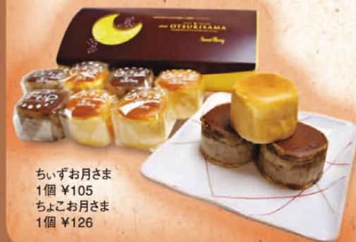
ちいずお月さま 1個 ¥105 ちよこお月さま 1個 ¥126