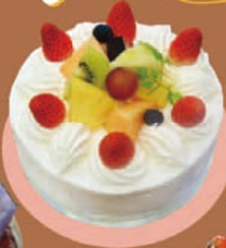
なかじま 「生クリーム デコレーション」 5号 ¥2,800