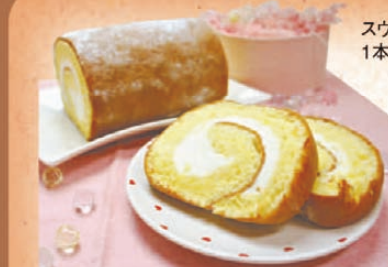
スウィートルール 1本 ¥945