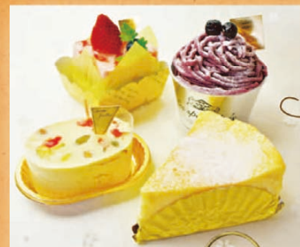
1/3・1/4セール開催! ケーキ10%OFF (各日先着30名様)