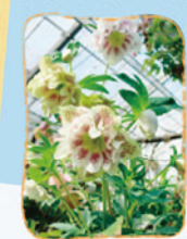
一冬の貴婦人「クリスマスローズ」

箱根の観光スポット強羅公園。ローズガーデンや熱帯植物館などの他、クラフトハウスでは陶芸や吹きガラス体験が楽しめます。季節ごとに様々なイベントもあり、2月中旬からはクリスマスローズ展も開催予定!