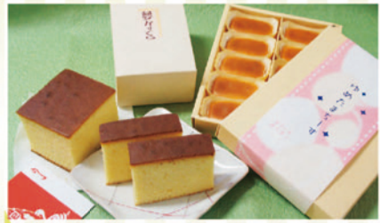
夢かすてら 箱入り ¥580

新年のご挨拶のお供に優しい甘さで味わい深い「夢かすてら」や木いちごのソースが入ったふわふわの「夢たまちーず」はいかがですか? 今年もお客さまの笑顔のどなりに夢たまごのスイーツがありますようにみなさまに愛されるスイーツ作りを目指して頑張ります。