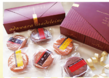
おだわら マドレーヌ3種 (ハチミツ・チョコ・黒糖) 1個 ¥126 6個入り ¥1,030 12個入り ¥1,848