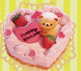
プティタプティ 「くまちゃんハート」 5号(ハート型) ¥3,150