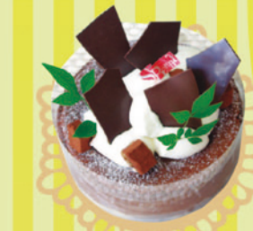
スウィートベリー 「蒸し焼きショコラ」 5号 ¥2,730