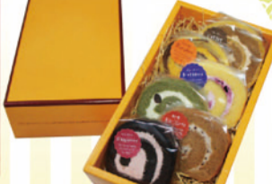
ロールケーキ 1個 ¥140~¥160 ギフト詰め合わせ ¥990~