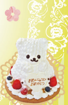
桜の樹 「白くまデコレーション」 ¥2,500