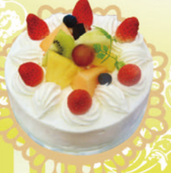
なかじま 「生クリームデコレーション」 5号 ¥2,800