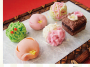
上生菓子 各¥210 (後列左から) 千両・福梅・千代の糸 (前列左から) あけぼの・咲分け・老梅

創業80年、富水駅前「創業工房なかじま」では伝統を受け継ぐ和菓子から、モダンスイーツまで四季折々の和洋菓子を取り揃えております。ご予約も承りますので、お土産にはもちろん、季節ごとの行事などにもご家族みなさままでぜひお召し上がりください。