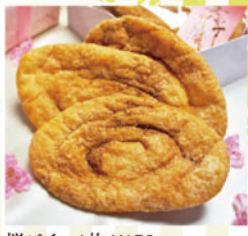
桜パイ 1枚 ¥150 10枚お箱入り ¥1,630

バターとともに桜の粉末を巻き込んで焼き上げた豊かな香りと、サクサクした食感で毎年大人気の「桜パイ」。今年も期間限定でお届けいたします。桜の花びらを散らして可愛らしく上品に仕上げました。桜模様の箱に詰め、ひと足早い春の訪れをプレゼントしませんか?