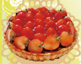
きゃとるふいーゆ 「イチゴのタルト」 5号 ¥3,200