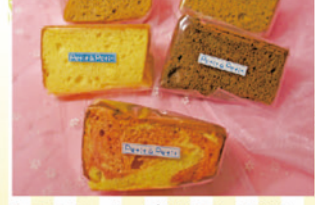
シフォンケーキ 1個 ¥270~¥280 *紅茶・プレーン・チョコ・アップルシナモン 苺と練乳など日替わりで3~5種類ございます

ほどよい甘さが人気のシフォンケーキ。軽〜くしてふわふわした食感が口いっぱいに広がります。オーソドックスな紅茶やプレーンの他、季節ごとのフレーバーも楽しめるオススメ商品です。今年もお客様から笑顔をいただけるよう真心のこもったスイーツをお届けいたします。