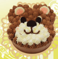
夢たまご 「くまちゃんデコレーション」 5号 ¥2,835