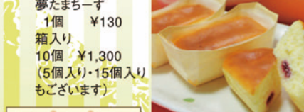
夢たまちーず 1個 ¥130 箱入り 10個 ¥1,300 (5個入り・15個入り もごさいます)