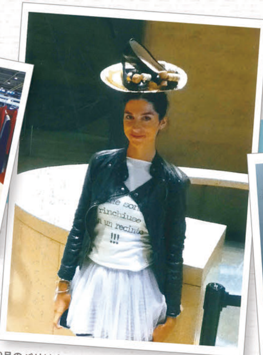
9月のパリはウィットに富んだモデルさんがあちらこちらを歩いていて、ひときわ目を引きます！