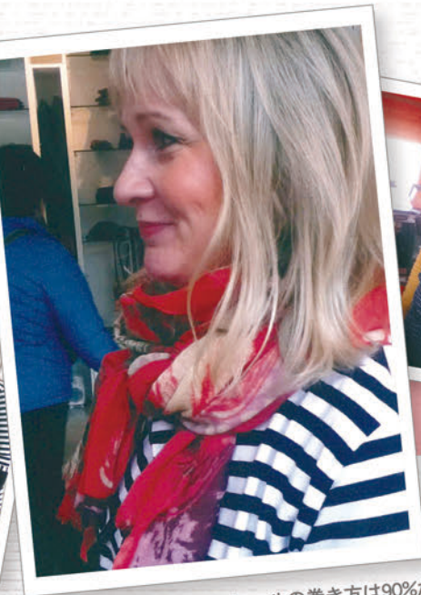
フィンランド女性のストールの巻き方は90%が「ぐるぐる巻き」！暖かいのはもちろんお顔まわりを明るく演出してくれます。