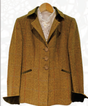
ジャケット T.ba(Spain) ¥65,940