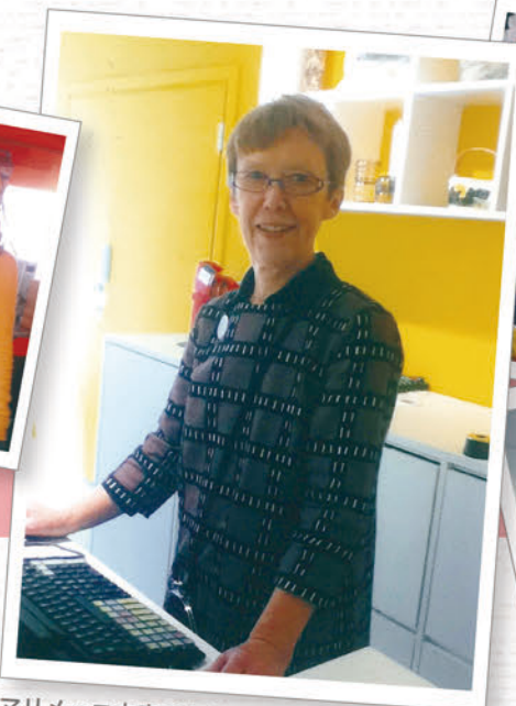
マリメッコ本店のカウンターでしっかりと店内を見守る熟練スタッフ。デザイン性の高いテキスタイルをさらりと着こなす姿はとても勉強になります。