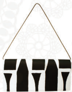
バッグ marrimekko(Finland) ¥19,950