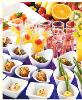
ランチbufféのみでもご利用いただけます。詳細はHPをご覧ください。