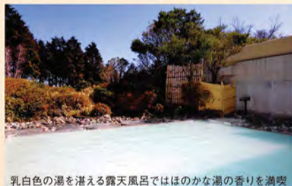
乳白色の湯を湛える露天風呂ではほのかな湯の香りを満喫

なめらかな乳白色のお湯が肌に心地よい湯の花温泉。美肌効果もバツグン、お肌もツルツルに! 女性に人気の温泉です。お部屋でリラックスできる温泉&ルームプランもオススメです。 箱根でいちばん空に近い露天風呂でのんびりとくつろいでみませんか?