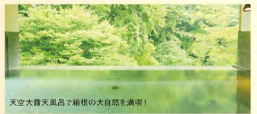
天空大露天風呂で箱根の大自然を満喫!

屋上天空大露天風呂から見渡す雄大な箱根の大自然。エステやマッサージで過ごす至福のひととき。 パワースポットとしても名高い玉簾の瀧など、そのすべてが癒しを与えてくれる天成園。 日曜・祝日には人気のランチバイキングも開催! ライブキッチンならではの出来たての味が楽しめます! 当日利用2,600円(税別)のところ事前のHP予約ならお得な割引料金に! 要チェックです!