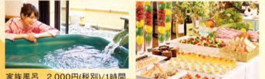
家族風呂 2,000円(税別)/1時間

Tel.0460-83-8511 (宿泊予約専用9時~21時) 箱根町湯本682 駐車場250台 「箱根湯本駅」から巡回バス(100円)で5分または徒歩12分 営業時間: 10時~翌朝9時まで http://www.tenseien.co.jp/