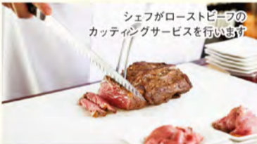
シェフがローストビーフの カッティングサービスを行います

湖畔のリゾートホテルで楽しむ人気のランチbuffet & 温泉 大自然あふれる箱根の山々に、雄大な富士山と芦ノ湖を望む箱根ホテル。 人気のランチbuffetではお料理からスイーツまでモダンな料理の数々をbuffetスタイルで気軽に楽し めます。露天風呂に浸かりながらゆったりとした時間を過ごせる、入浴券付きランチプランもオススメ! 湖畔のリゾートホテルで秋の箱根を心ゆくまで満喫できます。