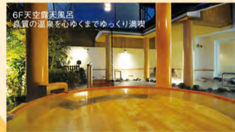
6F天空露天風呂 良質の温泉を心ゆくまでゆっくり満喫

落ち着いた「和」の館内には、露天風呂や貸切風呂はもちろん、休憩室やマッサージなどゆったり寛げ る施設もいっぱい!無料で楽しめるキッズコーナーや ゲームコーナー、マンガコーナーの他、卓球にカラオケな どなど、家族みんなで1日中楽しめる、極上の温泉郷です。