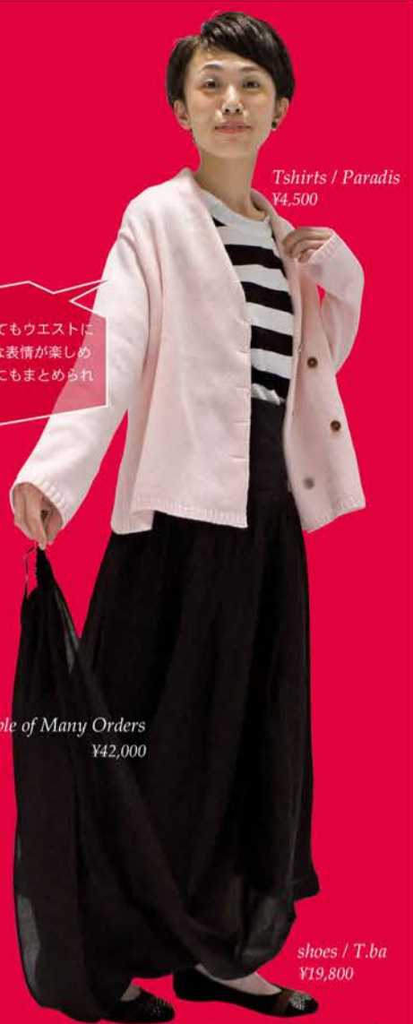
Tshirts / Paradis ¥4,500