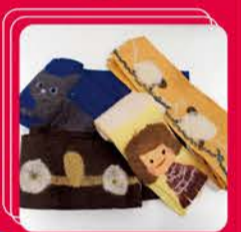
muffler / Asako Kuji ¥4,700~

ぬくぬくのモヘアは癒されますね。とにかく暖かくて軽い! キレイな色の組み合わせで、特に意識しなくてもこれ1枚で全体が女の子らしく見えます。