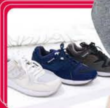
shoes White Mountaineering ¥22,000

こういうスタイルは自分的に一番落ち着きます。小さなお子さんがいらっしゃるお母様にもおすすめ。シャツは共布のくるみボタンで細部まで工夫されていますね。