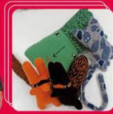
doll / donnawilson ¥7,000~