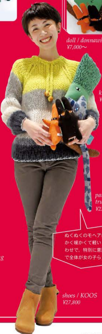
knit / Maiami ¥39,900