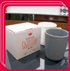
cup / able ¥3,000

長い裾の部分は手で持ってもウエストに留めてもOK! いろいろな表情が楽しめて、シックにもキュートにもまとめられると思います。