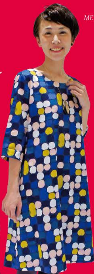
Tshirts METRO MARUTA ORIGINAL ¥2,500