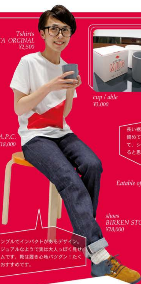
pants / A.P.C. ¥18,000