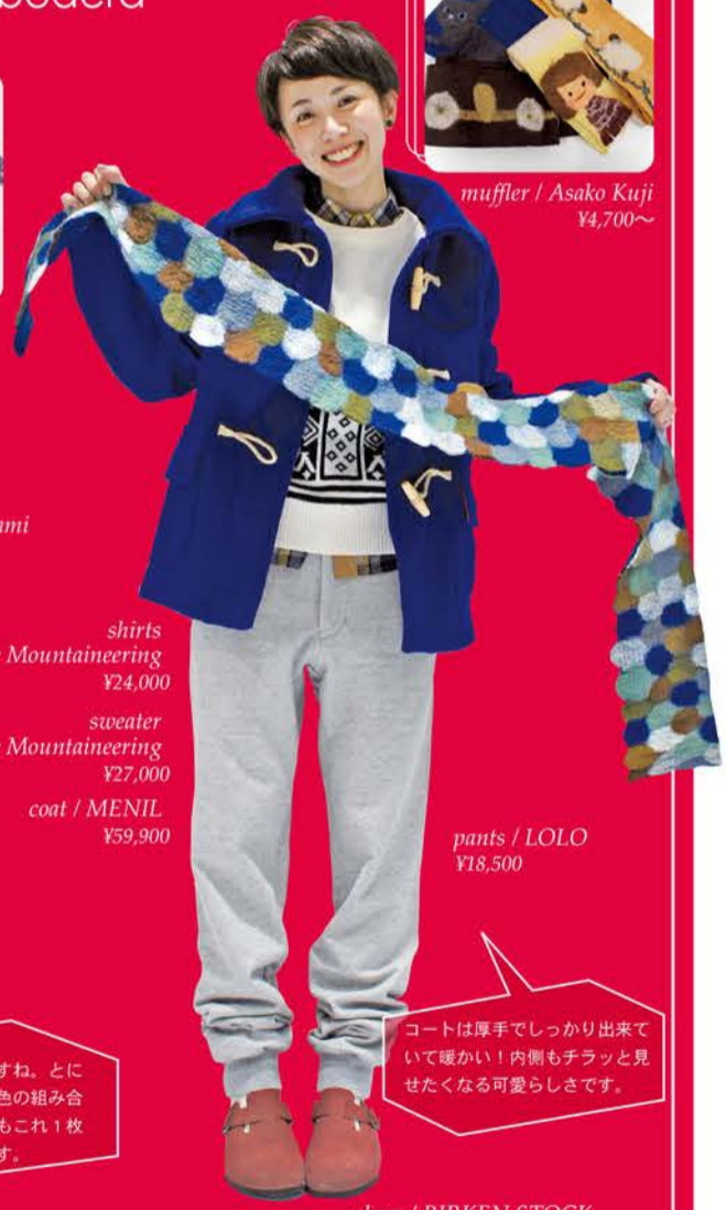
shirts White Mountaineering ¥24,000