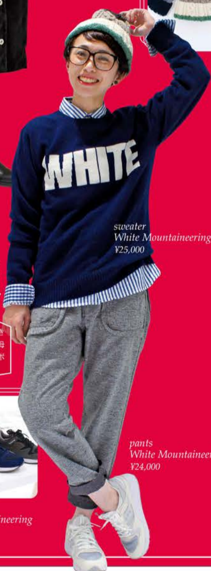
sweater White Mountaineering ¥25,000