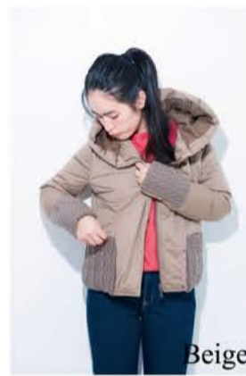
Short Hood Jacket ¥42,000