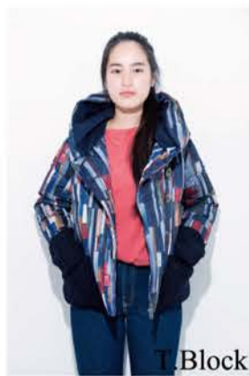
Short Hood Jacket ¥42,000