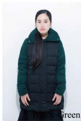
Big Collar Half Length Coat ¥42,000