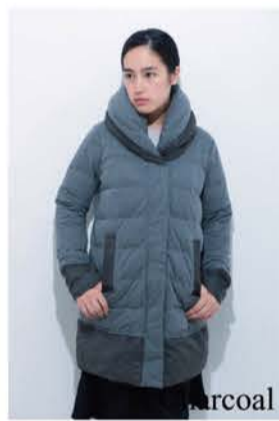
Two Piece Collar Coat ¥42,000

「あなたを 優しく 美しく 軽く 包み込む。 凛とした あなたを 着飾る 粧い。」 新素材「DualHex®」を使用したストレッチダウンウェアのブランドです。 スタイリッシュで都会的 街で着るためのスタンダードなダウンウェアを提案。 「粧う」は日本のブランドです。 「粧う」は洗練されたデザインを心がけます。 「粧う」は動きやすさとフィット感という相反する性質を持ち合わせます。 「粧う」はライフスタイル。 「粧う」は軽くてコンパクトにたためます。 「粧う」は秋冬に現れます。 「粧う」は100%の伸縮性なので様々なサイズやスタイルの方に幅広く着ていただけます。 「粧う」は様々なファッションスタイルに対応します。 「粧う」は家族みんなで着回せます。 「粧う」は粧う人に驚きと感動をあたえ笑顔にします。