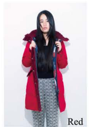
Long Stand Collar Coat ¥45,000