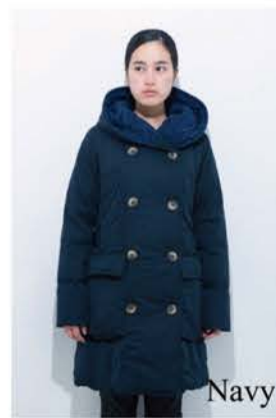
Big Food Coat ¥45,000