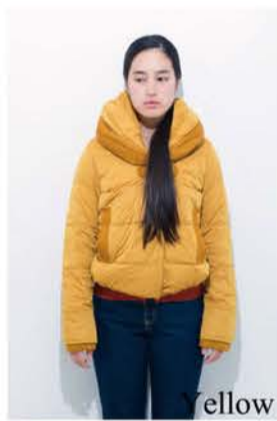
Two Piece Collar Jacket ¥38,000