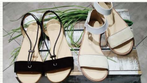
サンダル black ¥22,500 white ¥24,000

100%ハンドメイドの made in France のシューズ「モーリス」。マニアッシュな雰囲気の中にも女性らしさがあり、履き心地の良さもバツグンです!