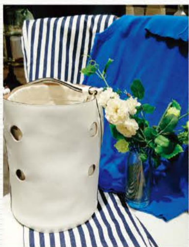
バッグ 2015年新作「JOY」 ¥138,000

いつまでも飽きることのない上質なバッグ&レザーグッズのコレクションは永遠のベシックと称されています。