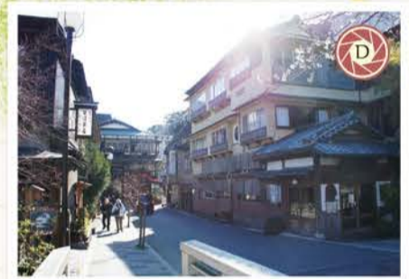
情緒豊かな温泉街、湯本通り