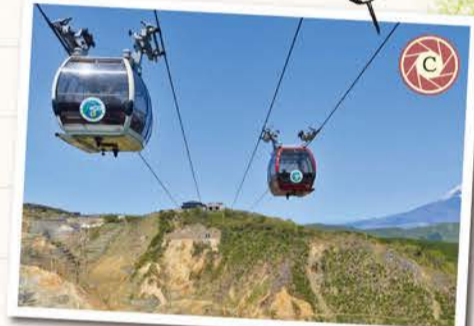
ロープウェイから見る大涌谷の自然