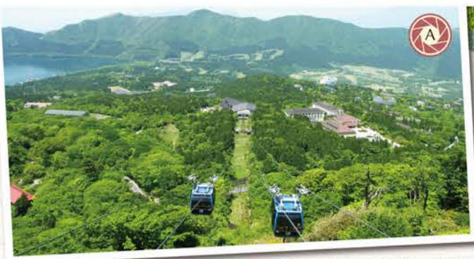
ロープウェイから見る新緑の箱根

雄大な富士山、穏やかに広がる芦ノ湖、目に鮮やかな新緑やつつじ、秋には黄金色に輝く仙石原のすすき高原など... どれも言わずと知れた箱根の観光スポットですが見る場所や時間によっても見え方はさまざま。 また、絶景ではなくとも風情ある町並みなど、思わずシャッターを押してしまいたくなる、そんな場所も箱根にはたくさん! 美味しいものに舌鼓を打ち、温泉で癒され、大自然を目で楽しむ、次の休日はカメラを持って気ままな箱根旅に出かけてみませんか?