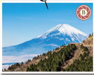
箱根スカイラインからの富士山