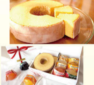
こだわりバーム Sサイズ¥1,188 /Mサイズ¥1,890

<下郷店> TEL.0465-43-8840 小田原市下郷95-1 9:30~19:00 (定休日)水曜日 (駐車場)有り