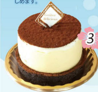
3 夢たまご 大人のタルトティラミス .....¥400

栢山、曾我さんのブラックベリーを使用。ほどよい酸味が爽やかで、他のベリー類よりも野性味豊かな味わいを楽しめます。