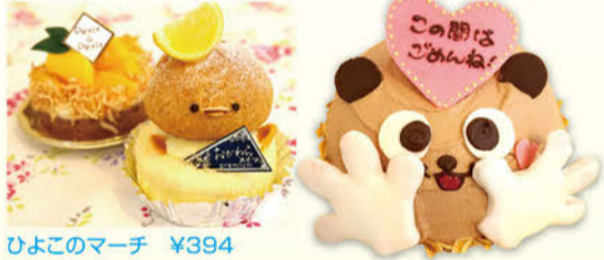
ひよこのマーチ ¥394 旬のゴロっとタルト ¥432〜 メッセージくまちゃん ¥2,000〜

「ひよこのマーチ」は湘南ゴールドやニューサマーオレンジなど旬の小田原ふる一つを使用したおだわらスイーツプレミアムバージョン! 旬のフルーツをふんだんに使用したタルトはマンゴー、桃、ぶどうなどが続々登場予定! メッセージくまちゃんは4号サイズから。気持ちを添えて贈りませんか? TEL.0465-37-8580 小田原市蓮正寺133-1-103 10:00~19:00 (定休日)月曜日 ※祝祭日の場合は翌火曜日 他不定休有 (駐車場)有り