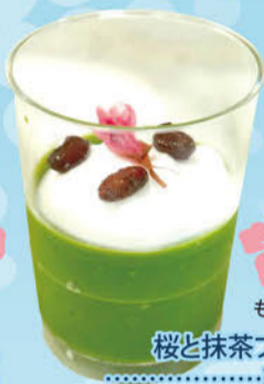
6 もくもく 桜と抹茶プリン .....¥230

甘酸っぱいオレンジとグレープフルーツにカスタードとチーズクリームの甘さがアクセントの爽やかなタルトです。