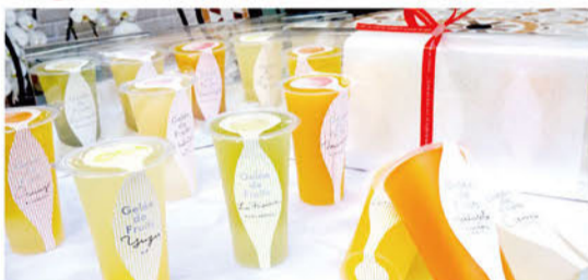
ジュレ 1個¥310/5ヶ入り¥1,760 /8ヶ入り¥2,793

夏にピッタリ、榎の樹ひんやりスイーツ!! フルーツがたっぷり入った8種類の榎の樹オリジナルジュレ。涼しげに店頭に並んでいます。お箱入りならギフトにおススメです!