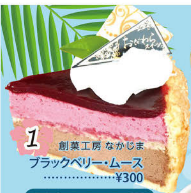
1 創業工房 なかじま ブラックベリー・ムース .....¥300