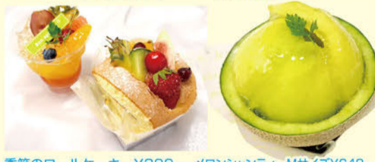
季節のロールケーキ ¥399 メロンシャンティ Mサイズ¥648〜 オレンジジュレ ¥324

ガロパン夏の人気商品が勢ぞろい! オレンジとレモンのゼリーが爽やかな「オレンジジュレ」、旬のフルーツがたっぷり「季節のロールケーキ」、この季節いちばん人気の「メロンシャンティ」は売り切れちゃうことも! まずはお店へGO!