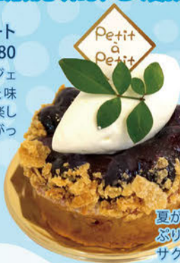
4 patisserie Petit a Petit ブルーベリータルト .....¥450

夏はやっぱり榎の樹のジェラート! 素材にこだわった味わいは大人から子供まで楽しめます♪ テラスで召し上がってみてはいかがですか?