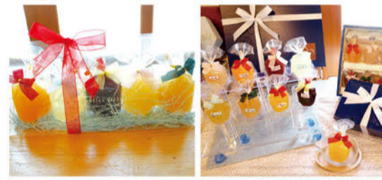
しずくゼリー 1個¥260/5個入り¥1,500 /10個入り¥2,900

新鮮なフルーツ果汁をたっぷり使った自家製「しずくゼリー」。フレーバーは全8種類。凍らせてシャーベットにしてもGOOD! 常温保存もできるので夏の贈り物にも最適です。