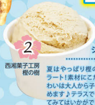
2 西湘菓子工房 榎の樹 ジェラート .....¥280

ブラックココアを使ったほろ苦タルトに、優しい甘さのティラミスはピターな大人の味わいです。