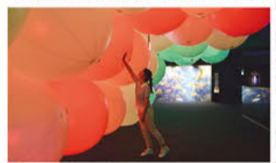
呼応する球体と夜の魚たち

新江ノ島水族館 Tel.0466-29-9960 藤沢市片瀬海岸2-19-1 営業時間/9:00~20:00 ※12/1~12/25は10:00開館 ※12/26~は17:00閉館 ※最終入場は閉館の1時間前 ※当日に限り再入場可