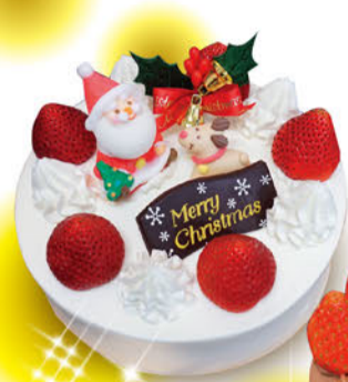
生クリーム5号 3,550円(税込)

今年も夢たまごはひとつひとつ心を込めた手作りケーキをお届けします。ご家族やお友達、大切な方と過ごすクリスマス。思わず笑顔がこぼれる夢いっぱいケーキでMerry Christmas!