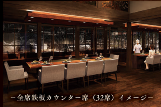
—全席鉄板カウンター席 (32席) イメージ—

国登録有形文化財建造物に登録されている迎賓館。 大正浪漫の和情緒溢れる空間で、贅を凝らした逸品を、 心ゆくまでご堪能ください。