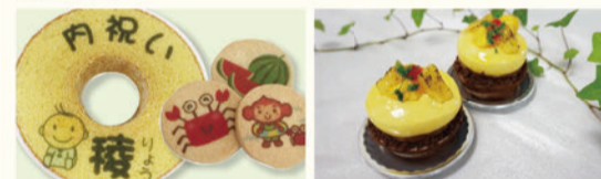
「オリジナルバーム」 Sサイズ以上 1個¥1,296~ 「オリジナルクッキー」 10枚以上 1枚¥108 要予約(3日前まで)

スウィートベリーではあなただけのオリジナルバームやクッキーが作れます。写真やメッセージなどお好きなデザインで、オリジナルバームやクッキーを作ってみませんか?お誕生日のお祝いや、お返しなどプチギフトとしても最適!(デザインによりお引き受けできない場合もございます・画像の修正等は出来ません。)