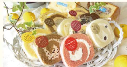
ロールケーキ 1個¥150~¥160 シフォンケーキ 1個¥303~¥314

人気のロールケーキに季節のメニューが仲間入り!夏限定はもも、マンゴー、塩など。7月中は地元の湘南ゴールドロールも。その季節にしか食べられない旬のロールがおススメ!また、ふわふわのシフォンケーキも全8種類のうち日替わりで常時3~4種類が店頭♪