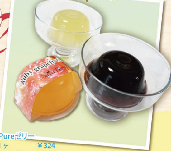
Pureゼリー 1ヶ ¥324 3ヶ入り ¥972 6ヶ入り ¥1,944 12ヶ入り ¥3,888

やわらかくてぷるんとした食感の「Pureゼリー」は全部で12種類。箱入りなら夏の贈り物にもぴったり♪