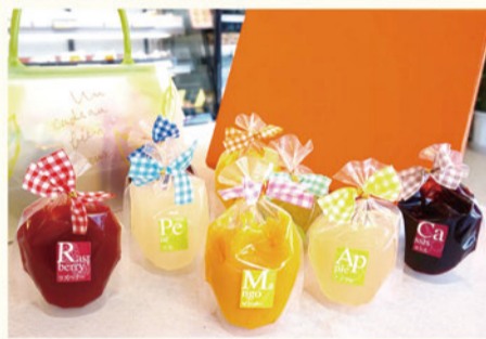
フルーツゼリー / 1個¥210

ジュシーでなめらかな口当たりのフルーツゼリーは洋梨・ラズベリー・マンゴー・アップル・グレープ・オレンジ・カシス・梅の全8種類手軽なバッグ入りとお箱入りで、シーンに合わせて夏の贈り物にいかがですか?