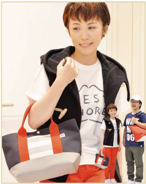
(レディース) *ベスト「gloverall」¥39,000+Tax *Tシャツ「WEST SHORE」¥5,000+Tax *パンツ「true nyc」¥23,800+Tax *靴「adidas」¥15,490+Tax *バッグ「ueyama canvas」¥7,000+Tax (メンズ) *Tシャツ「White Mountaineering」¥8,500+Tax *パンツ「White Mountaineering」¥26,000+Tax *靴「adidas」¥15,490+Tax *帽子「A.P.C.」¥15,000+Tax *バッグ「Herve Chapelier」¥16,800+Tax