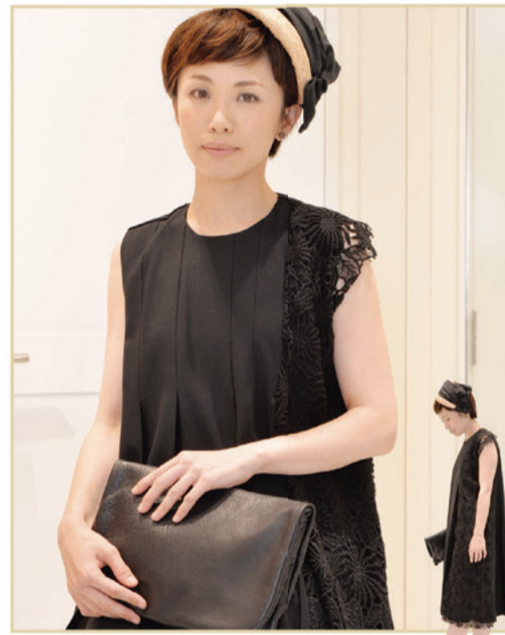
*ワンピース「TELA」¥40,000+Tax *ヘアアクセサリ「gasa」¥15,000+Tax *靴「UNITED NUDE」¥25,000+Tax *バッグ「Owen Barry」¥19,000+Tax