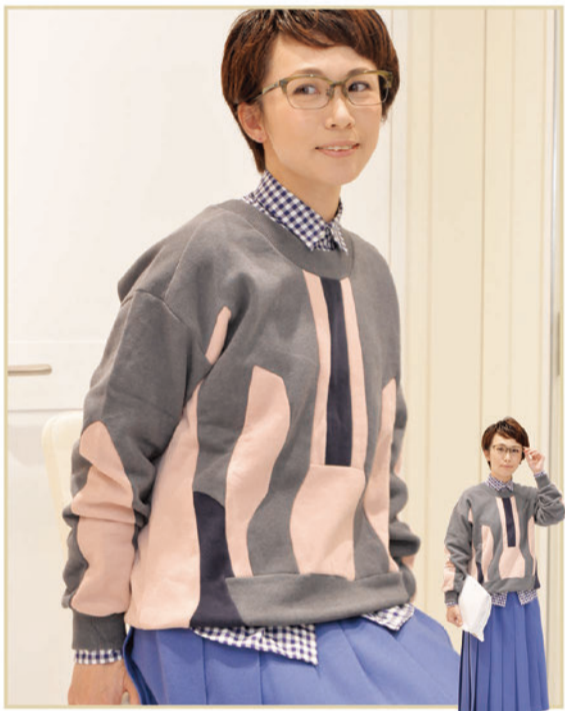
*スウェット「OMSK」¥26,000+Tax *シャツ「STANDART AT HAND」¥13,800+Tax *スカート「Charpentier de Vaisseau」¥13,800+Tax *靴「Lepetto」¥35,000+Tax *バッグ「Owen Barry」¥19,000+Tax