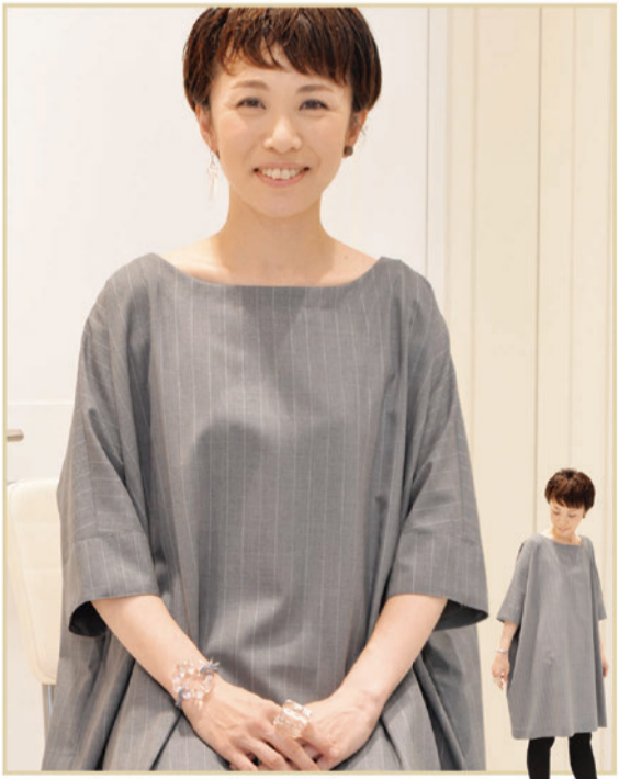
*ワンピース「STAMP AND DIARY」¥23,000+Tax *プレスレット「SIRI SIRI」¥21,000+Tax *リング「SIRI SIRI」¥25,000+Tax *ピアス「SIRI SIRI」¥38,000+Tax *靴「UNITED NUDE」¥25,000+Tax