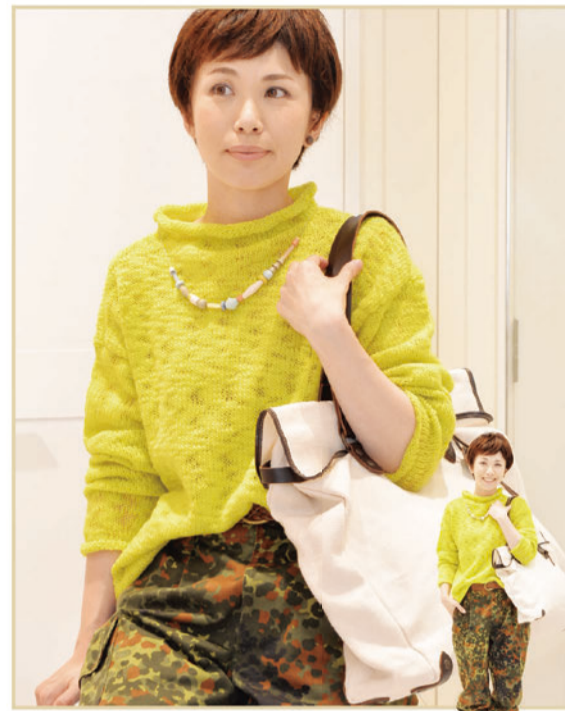
*ニット「EATABLE of Many Orders」¥26,000+Tax *パンツ「Vintage」¥8,900+Tax *ブーツ「KOOS」¥33,800+Tax *ネックレス「Apres ski」¥12,900+Tax *バッグ「TAMPICO」¥27,000+Tax *ベルト「ANGLO」¥9,800+Tax