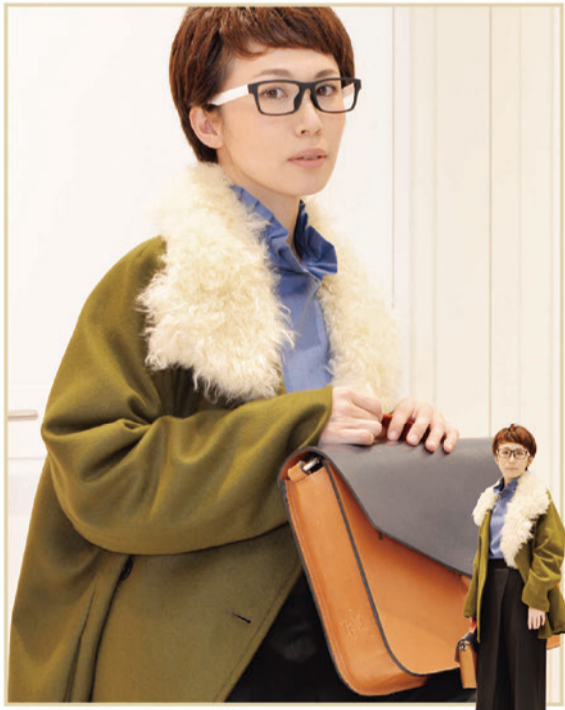
*コート「TELA」¥59,000+Tax *ブラウス「TELA」¥19,800+Tax *パンツ「TELA」¥26,000+Tax *バッグ「TELA」¥30,000+Tax *靴「NATIVE VILLAGE」¥46,000+Tax