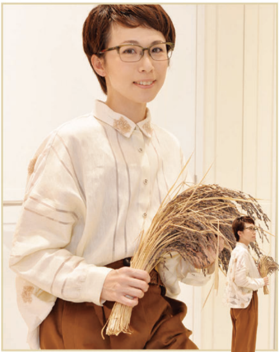
*ブラウス「NATIVE VILLAGE」¥33,000+Tax *パンツ「TELA」¥25,000+Tax *靴「NATIVE VILLAGE」¥46,000+Tax