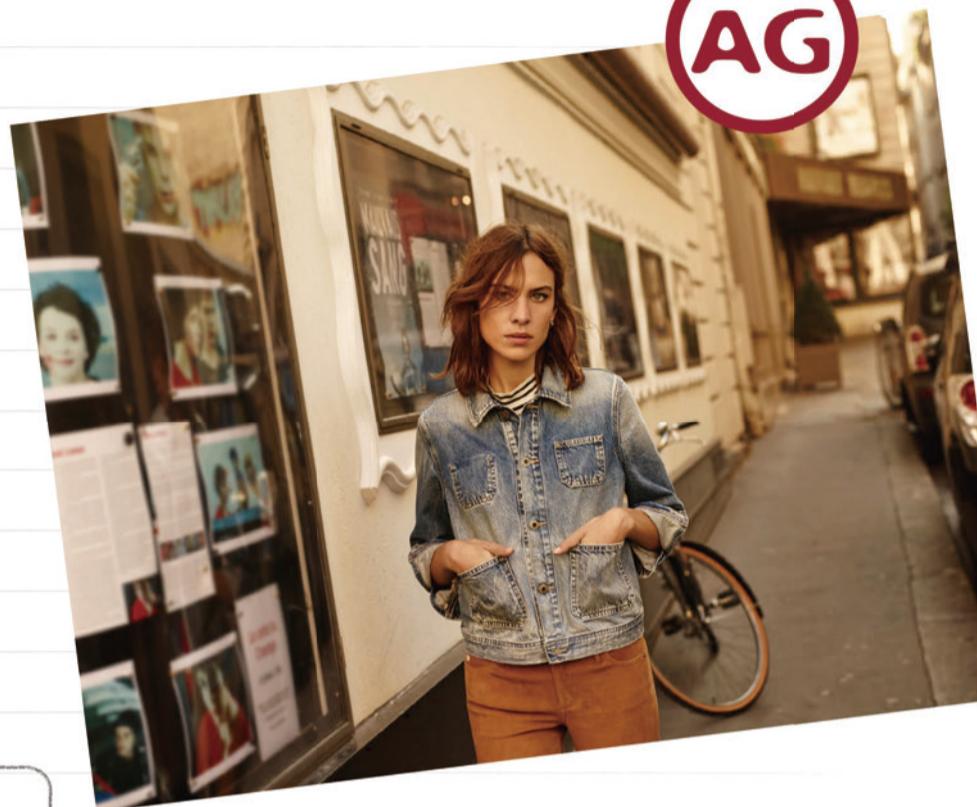
PIPER CROP boy fit crop

細身のスーパースキニー。 裾までぴったりとしたシルエットで靴を選ば ず一年中着回せます。フィットするけど 締めつけ感なく心地よくはけます。