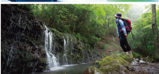
ヨガやトレーニングなど、大自然を肌で感じる充実のアクティビティ。