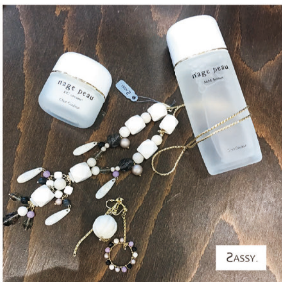
SASSY Earrings ¥6,800+Tax Necklace ¥14,000+Tax Cher-Couleur MM lotion ¥3,800+Tax EC cream ¥5,000+Tax