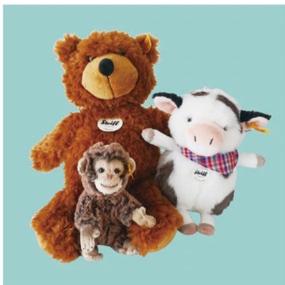
Steiff charly ¥6,500+Tax mini cow ¥5,400+Tax Key chain ¥3,300+Tax