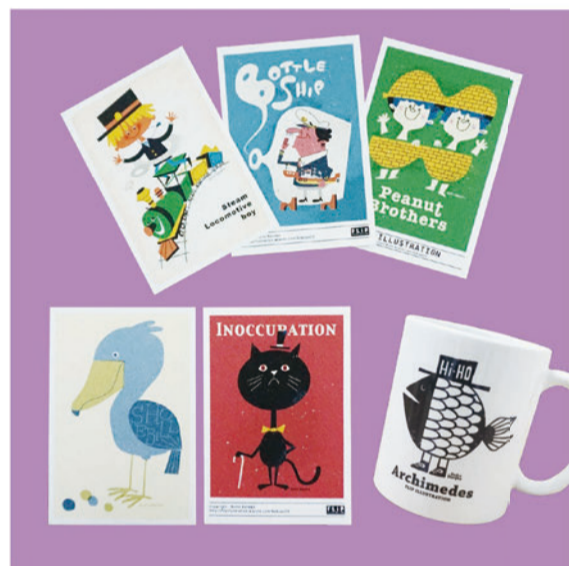
FLIP ILLUSTRATION by Norio Kaneko POST CARD ¥180+Tax Mug ¥1,800+Tax