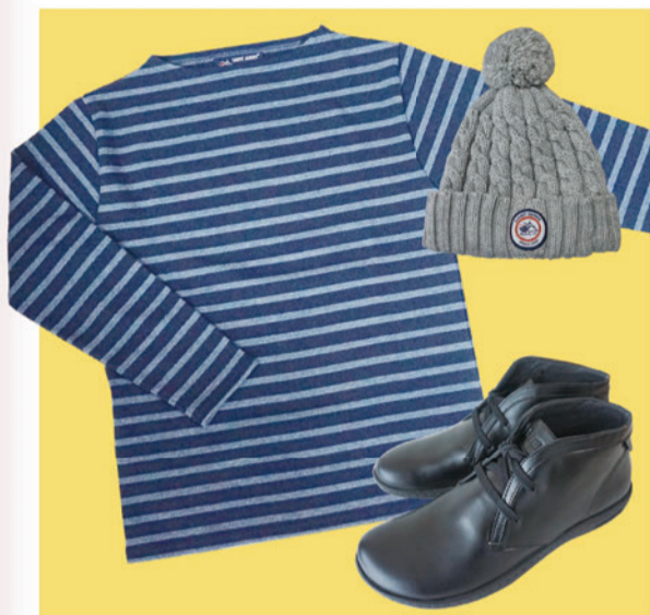
SAINT JAMES ¥10,000+Tax Knit CAP ¥7,500+Tax BIRKENSTOCK ¥23,000+Tax

新年あけましておめでとうございます。 2018年は今まで大切にしてきた事と共に 生まれ変わるMARUTAJOYにご期待ください！ 本年も皆様にお会いできる事 心から楽しみにしております。