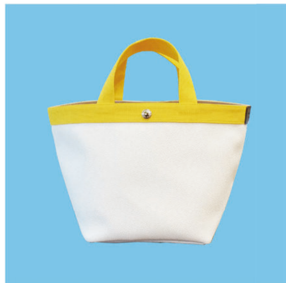
Herve Chapelier 707GP ¥68,000+Tax