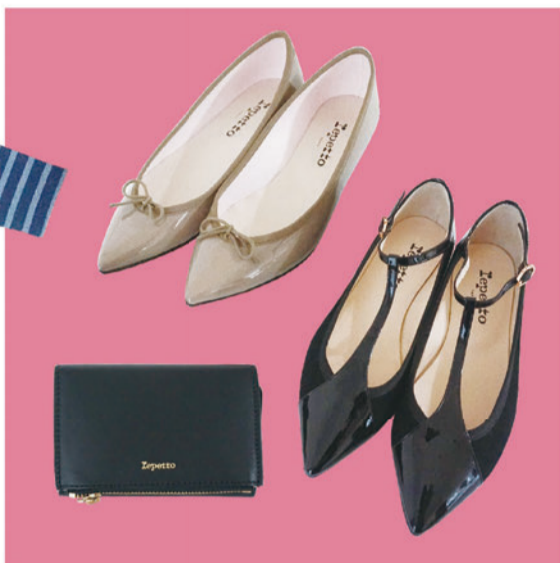
repetto BRGTE ¥46,000+Tax CHIC ¥49,000+Tax Wallet ¥33,000+Tax