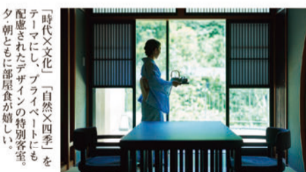
「時代×文化」「自然×四季」をテーマにし、プライベートにも配慮されたデザインの特別客室。35平米と広さも申し分なく、開放感たっぷり。