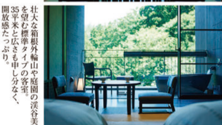
壮大な箱根外輪山や庭園の溪谷美を望む標準タイプの客室。