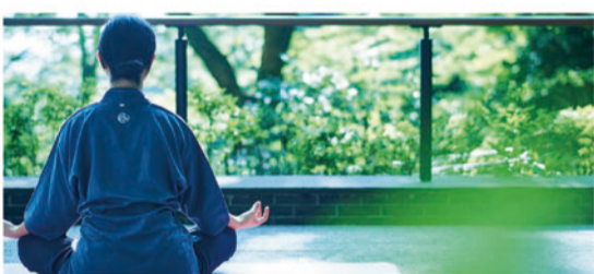
ヨガやトレーニングなど、大自然を肌で感じる充実のアクティビティ。